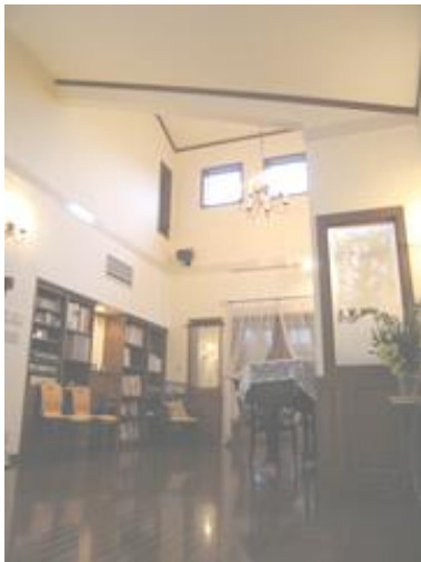
レッスン会場 シェモザー